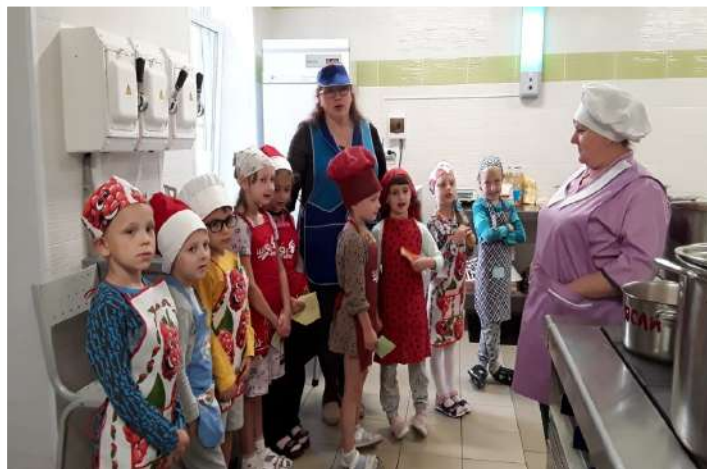
«Борщ от Шеф-поварят»